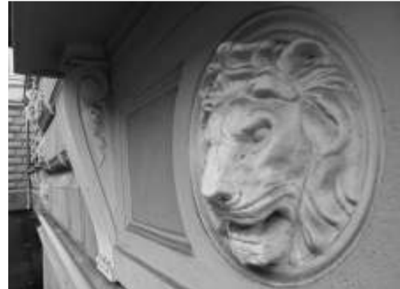
A törvényszék és börtön egyik oroszlánfeje a nyolc közül