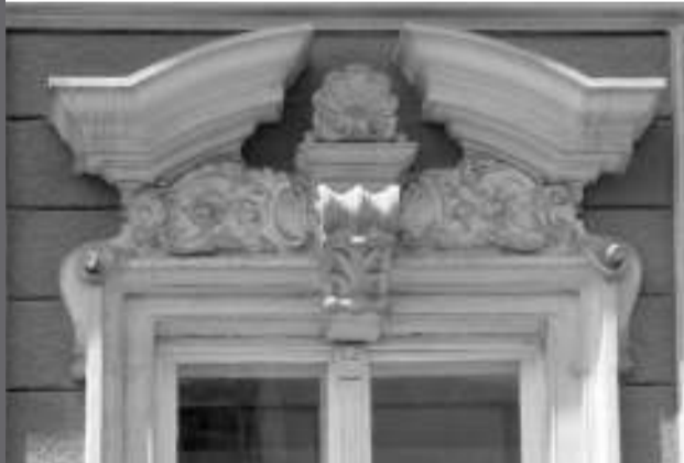
Kazinczy/Ştefan cel Mare utcai bérház homlokzatának részlete