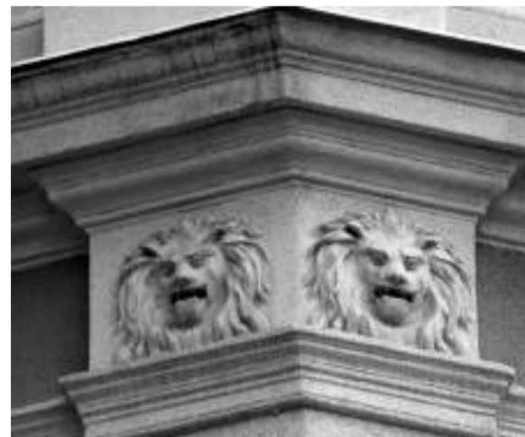
Az Astoria szálló oroszlánjai