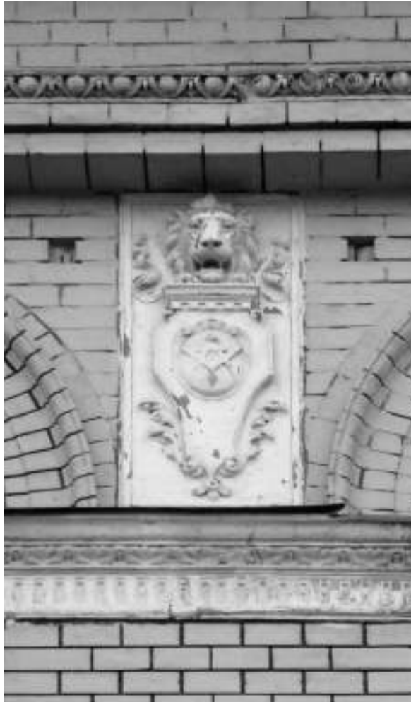
A szatmári állomás oroszlánfejes domborműve