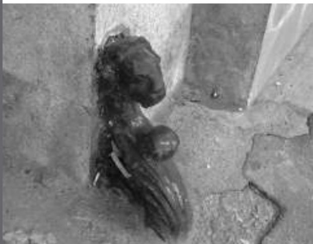
Az egykori Korona szálló kerékfogója