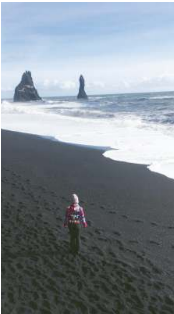
Vík közelében, ahol a jó és rossz tündérek élnek

Örülhet az utazó: az őshonos póni látványának, mivel más emlős állat nem igazán található a természetben; ha egy-egy madár elröpül fölötte vagy láthatja a távolból, legyen az a jellegzetes lunda, sirály vagy sas; a friss, fehér húsú halnak, a homáros pizza ízének; a finom és tiszta csapvíznek; ha süt a nap és nem havazik vízszintesen a szél miatt; vagy ha havazik is, hogy éppen a geotermikus fürdők egyikében — legyen az a csodálatosan szép, viszont nagyon drága és kissé turistás Kék Laguna, a barátságos és finom ételeket felszolgáló Fontana, vagy a Titkos Laguna —, a 38–40 fokos gyógyvízben ülve olvadnak el a fürdőző vállán a hópelyhek; ha pár napra kiköltözik a természetbe a barátaival, szeretteivel és távol a civilizációtól, egy izolált kis kék faházban beszélgethet, mosolyoghat, játszhat és hálát adhat azért, hogy a természet még mostoha körülmények között, leigázatlanul sem pusztítja el, még így is mennyire gyönyörű. Hazaérve pedig még csodálatosabbnak tűnik az itthoni tavasz, ahogyan a fák virágba borulnak, a kertekben és a piacokon megjelennek az első, szabad ég alatt növekedett tavaszi termések. A madarak csicsérgése. Minden, amit mi olyan természetesnek veszünk és folyamatosan csak elveszünk. Hiszen biztosra vehető, hogy valamikor döntő fontosságú lesz az a pont, amikor már nem az számít, hogy mi van az egyén birtokában, hanem mit ad másoknak, a természetnek, és mit nem vesz el tőle.