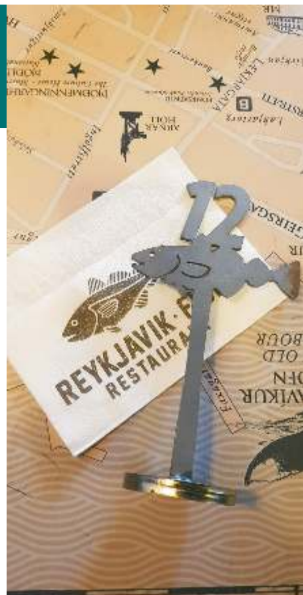
A legfinomabb tőkehalú fish and chips

Izland kétségtelenül egyike Európa legizgalmasabb tájainak, noha hallani lehet a csendet, mégsem nyugszik egy pillanatra sem. A Közép-Atlanti-hátságban fekszik, az amerikai és európai tektonikus kőzetlemezek határán, az állandó mozgások eredményeképpen alakult ki ez a látványos táj, ma is 12 aktív vulkánal, lávafolyamokkal, gejzírekkel. William Shakespeare tűz és jég párosítása a Szeget szeggel alkotásában kitűnően leírja e sziget kettősségét, ahol a gyakran 80–100 fokos kénes víz tör elő a hóborította mélyből. A Nagy Gejzír övezetben elhelyezkedő Strokkur (Köpülő) gejzír Izland egyik fő látványossága 5–10 percenként tör ki, a vízszlop magassága eléri a 20 métert, a Geysir gejzír,