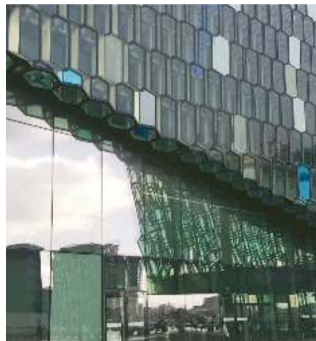
Harpa hangversenyerem, a visszatükröződő felhők és hullámok