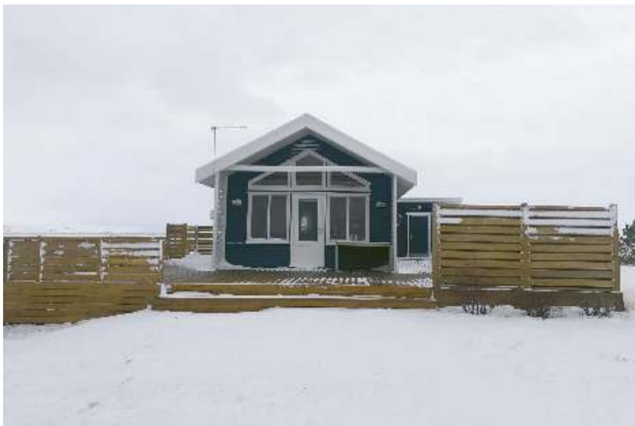
Kicsi kék ház a gyönyörű pusztában