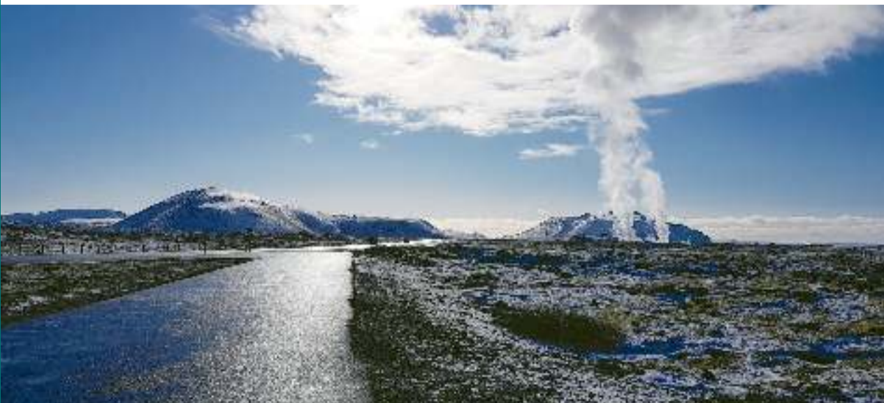
Bármerre is néz az utazó, kissé földönkívüli a hatás

A bevezetőben említett útikönyvben olvastam az alábbi: „A helyiek demonstrációt szerveztek a közelmúltban egy Reykjavík közelében tervezett útépítés ellen, a tündérek élhetőbb sziklafalainak védelmében. A tündérhívó tiltakozók — akik egy felmérés szerint az izlandi lakosság több mint 50%-a — egyszerűen képviselték természet- és nemzetvédelmi érdekeiket, és mindvégig bíztak a környező lávamezők és a történelmi kedvenceik érdeké-