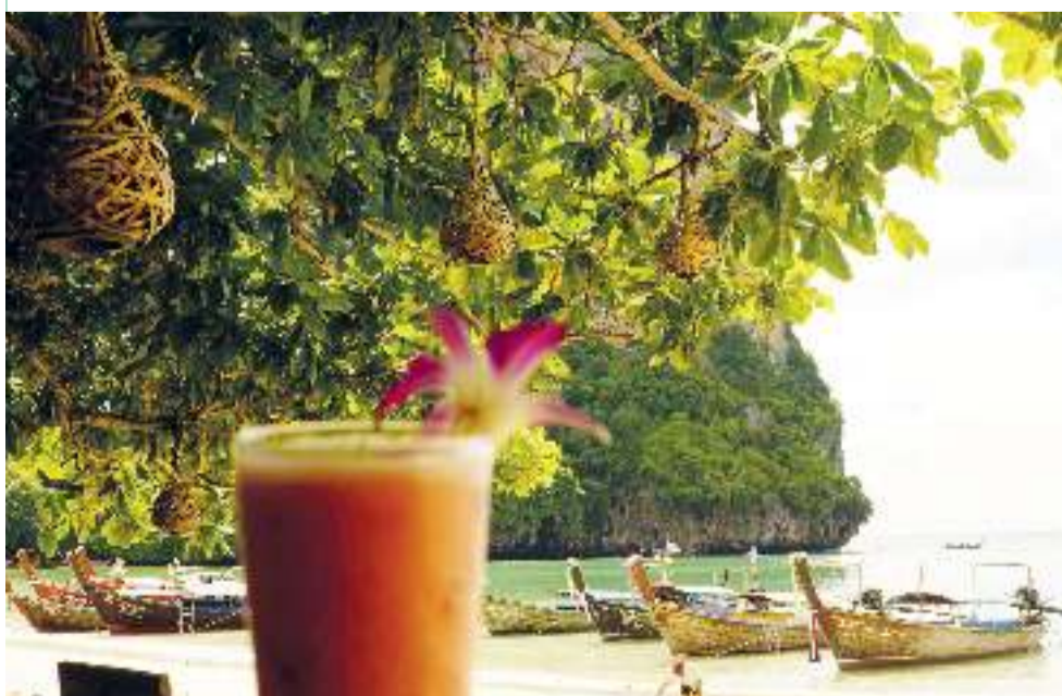
Railay-öböl hosszúfarkú csónakokkal