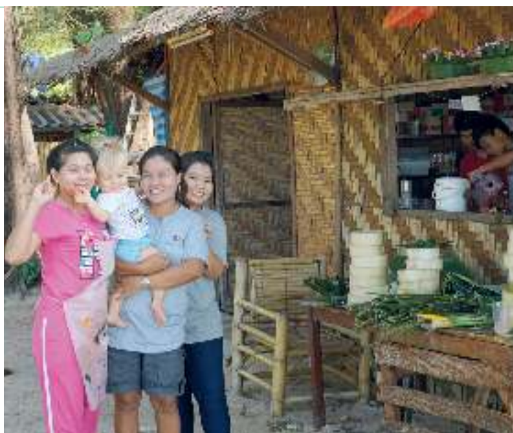
Barátkozás a szöke kisfiúkkal Krathong-készítés alatt