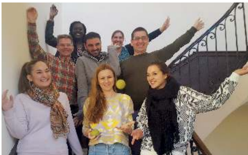
Játszva, közösen tanulni, avagy francia nyelvtanfolyam Montpellier-ben