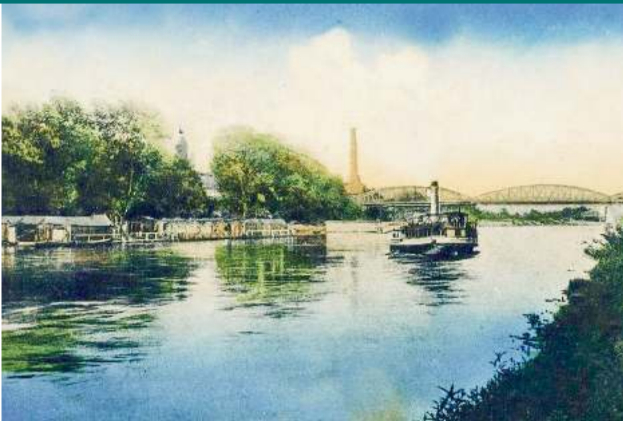
Szatmárnémeti Anno (Facebook csoport), egyéb Facebook megosztások, Wordpress.com, személyes felajánlások

Visszatérve a hajózható Szamoshoz, Széchenyi terveit az 1848-as forradalom és szabadságharc kitörése miatt nem tudta teljesen megvalósítani, de miután a Szamos medrét rendszeresen kotorták, az 1900-as évek elején kisebb gőzhajók közlekedhettek rajta. Így a Regatta Szamos Csónakázó Egyesület hajója, mely a folyó városi szakaszán közlekedett és amelyiknek kikötője a Szamos-híd (közúti vas-híd) közelében állt. Ugyanitt az egyesületnek uszodája is működött. Ennek közelében horgonyzott a kotróhajó — ez a harmincas évek végéig állt ott, aztán sörözőt működtettek benne a hetvenes évek közepéig.