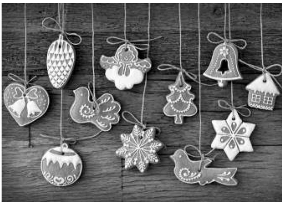
Hagyományos karácsonyi díszek