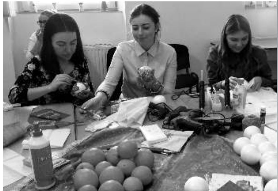
Ünnepváró a BBTE Szatmári Tagozatán