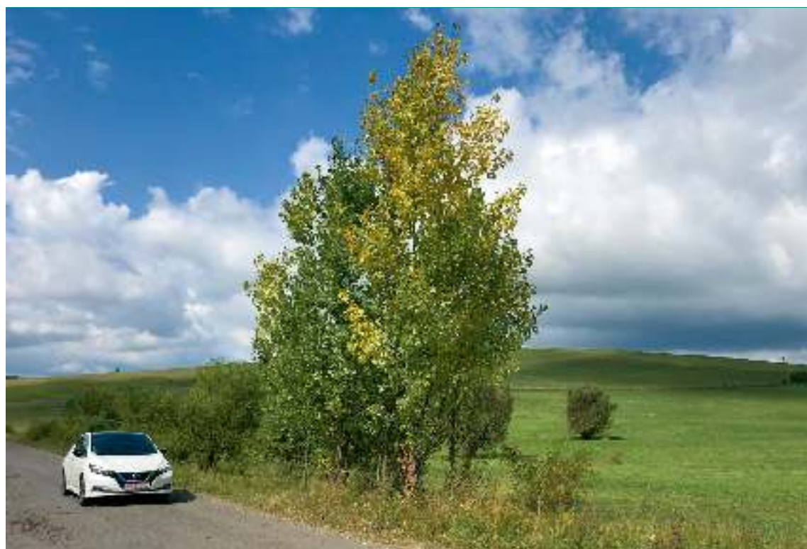
Folytatás a 8. oldalról