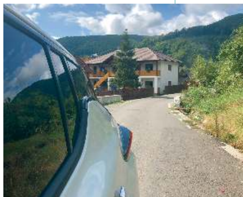
100%-os töltöttséggel hagyjuk el a parajdi szállásunkat