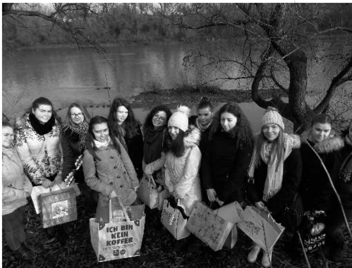
Látogatóban Vízhati Szamolcsnál