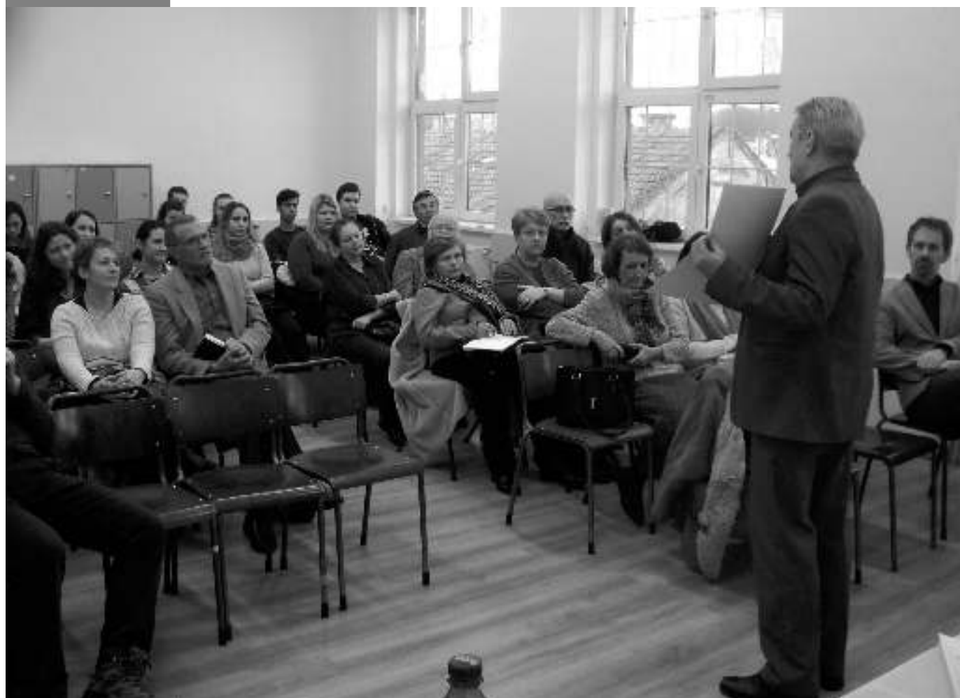
Kolozsvár, Apáczai Líceum

A vizuális nevelés módszertanával habzóiban szűk három évtizede, a kilencvenes évektől kezdtem foglalkozni, amikor pedagógiai líceumok, posztliceális óvó- és tanítóképzők létesültek, alakultak újra Szatmárnémetiben. A feladatokat akkoriban a körülmények, elvárások szülték. Ha nem tanítok a Turisztikai Technikumban, talán sohasem írok városismertetőt, a leendő óvó- és tanítónőknek a mi tapasztalatainkon alapuló forrásokra, szemléltetőkre, reprodukciókra volt szüksége a gyakorló tanításokhoz, szemináriumi bemutatókhoz, diplomamunkákhoz. Írnom kellett tehát számukra egy módszertani útmutatót, amin alig száradt meg a nyomdafesték, máris kevésnek bizonyult. A vizuális neveléshez, a kreativitás, kezdeményező-készség fejlesztéséhez, az egyedi kivitelezéshez a könyv ugyanis már akkor sem