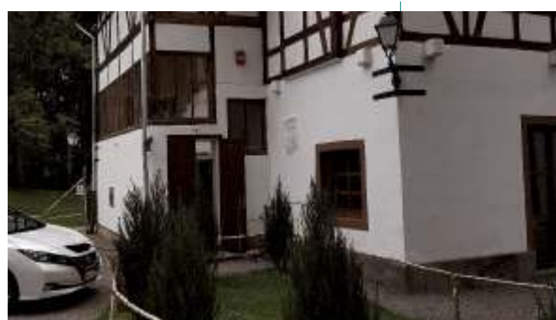
A Mikes-birtok gépezsháza