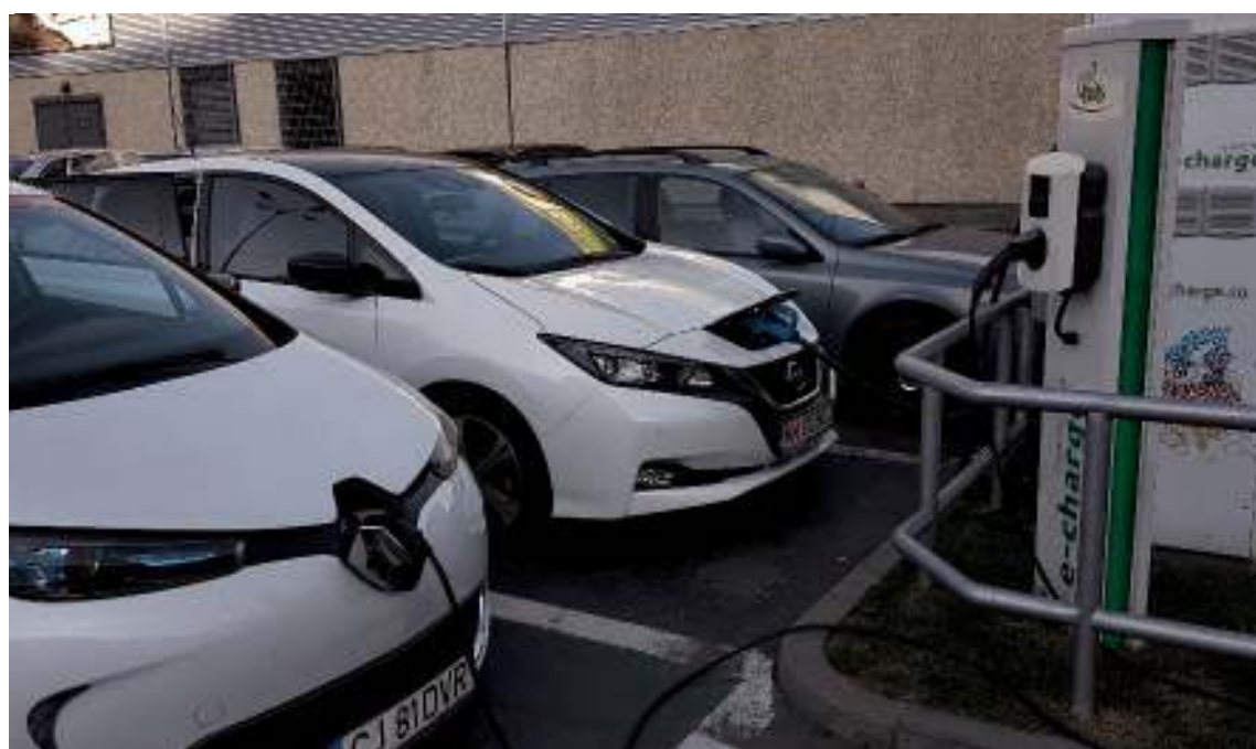
Párhuzamos töltések Kolozsváron