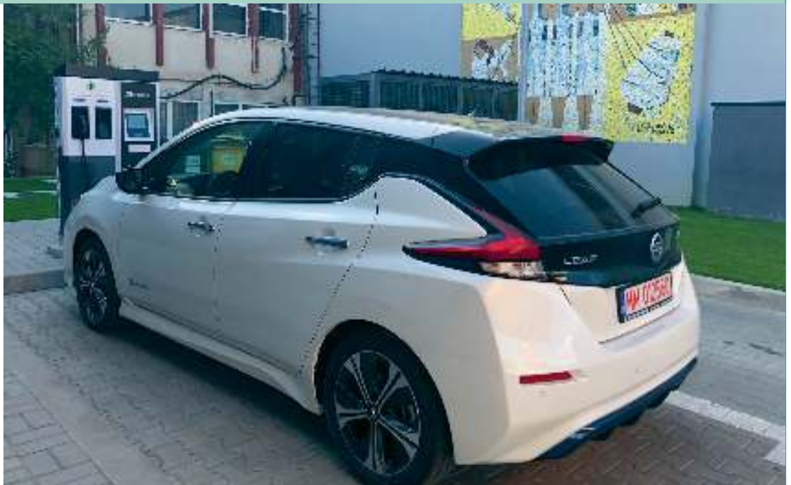
Az első töltőállomáson a nagybányai benzinkútnál

A Nissan Leaf-ünkkel 2018. szeptember 6-án gurultunk ki a nagybányai márkakereskedésből. Egy éven át tartó ár, technikai, esztétikai szempontokat latolgató tanulmányozás, főleg a férjem részéről, blogok, leírások követése, illetve pályázások előzték meg. A külvilág eléggé szkeptikusan viszonyult, hiszen egy olyan városban terveztük mindezt, történetesen Szatmárnémetiben, ahol az új pláza megnyitásáig (2018. december 6.) a legtöbb erdélyi, főleg nagyobb várossal ellentétben egyetlen villámtöltő (CHAdeMO, CCS, Tesla Supercharger) sem volt. Type2 típusút, ami váltóáramú, ezáltal lassúbb töltési lehetőséget biztosít, kb. 6 órát jelentve, az egyik hotel parkolójában is láttunk már 2018 őszén. Viszont a saját városban mindez nem is olyan lényeges, főleg, ha házban lakik az ember, és egy egyszerű hosszabbítóval vagy fali töltővel, noha váltóáramon keresztül, 6,6–7,4 kW sebességgel akár éjszakai mobiltöltő üzemmódban feltöltheti a kocsiját. Bővebb, és folyamatosan frissülő infókat a világ elektromos töltőállomá-